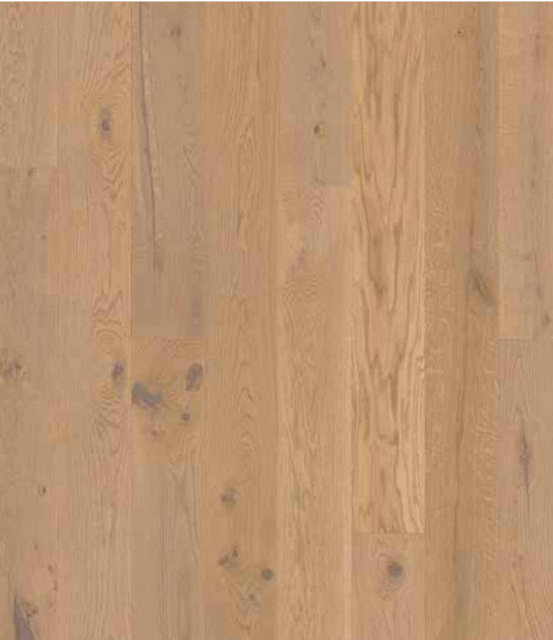
DIELN-OPTIK | EICHE AUSTER | WILD BUNT (ORIGINAL) GEFAST, GEBÜRSTET