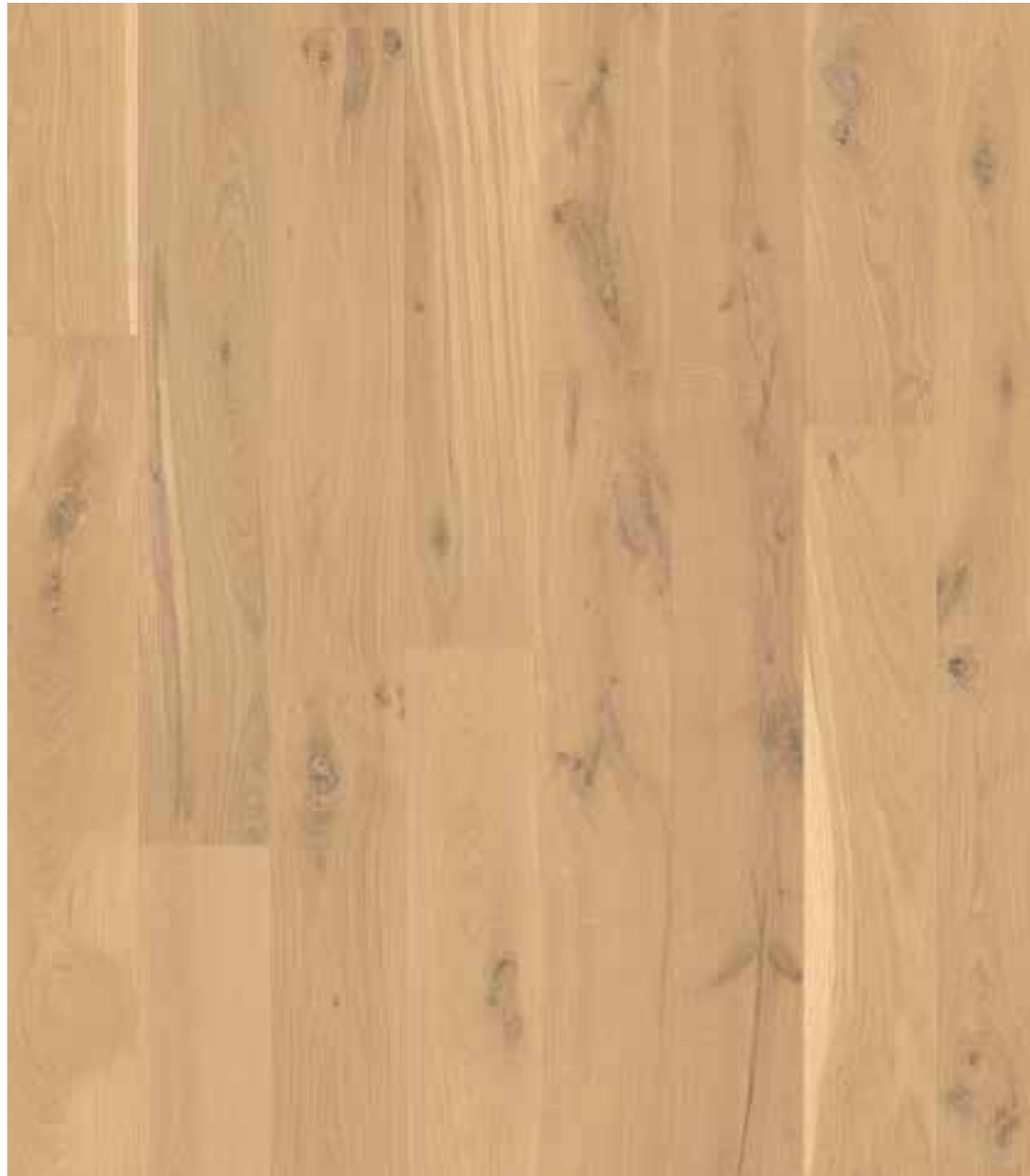
DIELN-OPTIK | EICHE KASCHMIR | WILD BUNT (ORIGINAL) GEFAST, GEBÜRSTET