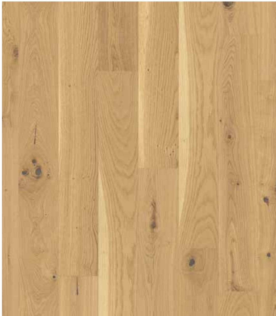
DIELEN-OPTIK | EICHE PURE | WILD BUNT (ORIGINAL) GEFAST, GEBÜRSTET