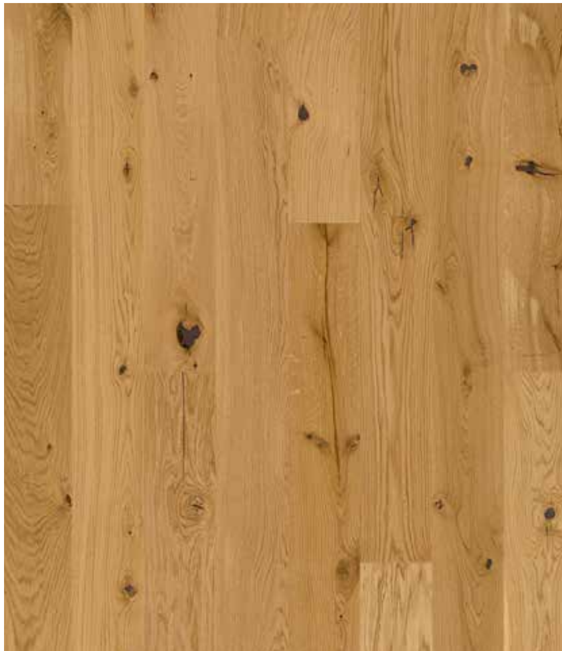
DIELEN-OPTIK | EICHE | WILD (ORIGINAL*) GEFAST, GEBÜRSTET